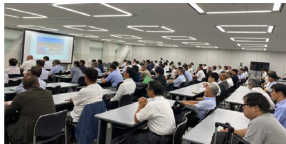
← 最後の講演者(熊本市)まで満席状態