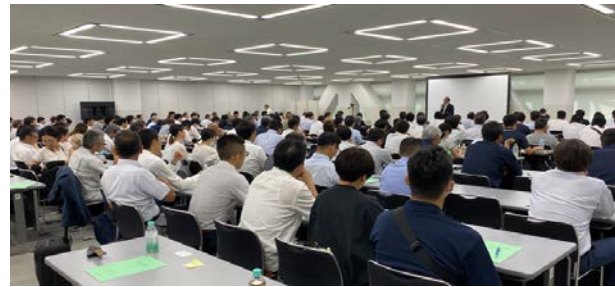
↑ 冒頭の会長挨拶から満席