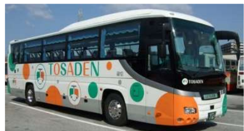
※車体デザインは変更になる場合もあります

※道路事情による遅れ、満員による早期出発、満員のためにご乗車いただけない場合もありますので、時間に余裕をもってご利用ください。